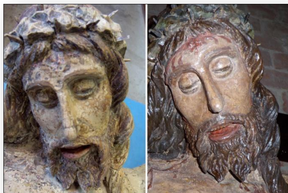
Volto del Cristo a confronto

denunciato, unitamente ad altri elementi caratteristici, la datazione al tardo medioevo o, al massimo, agli inizi del rinascimento.