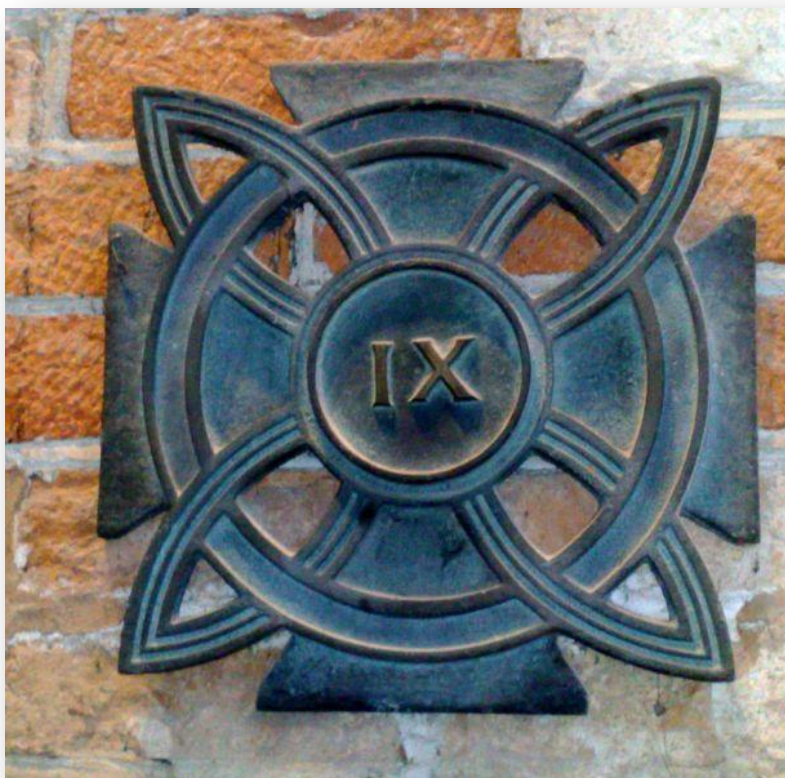
La Via Crucis del Tempio è stata fusa nel 1956 a cura del Comune di Voghera con l'ottone fornito dal Ministero della Difesa