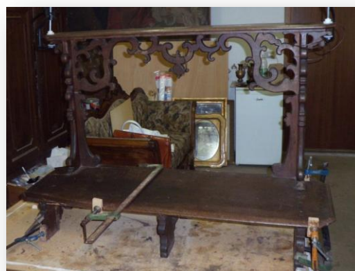
l'inginocchiatoio in fase di restauro